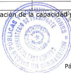
Tabla 2. Descripción de puntajes para la evaluación de la capacidad patrimonial y financiera

Filipino R. Fernández Blanco. Viceministro de Transporte MOPT